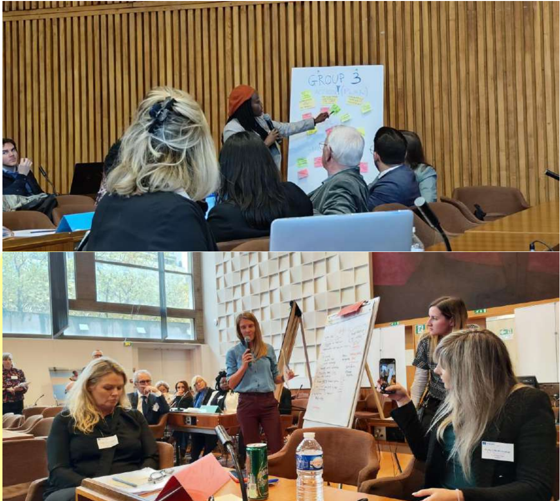
Ejemplos de actividades que se realizaron durante este encuentro